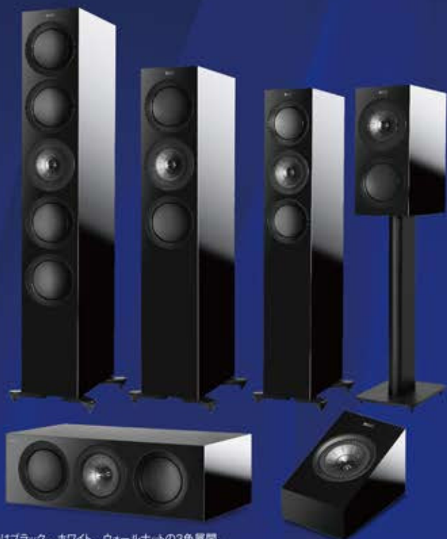
カラーはブラック、ホワイト、ウォールナットの3色展開。 カラーによって価格が異なります。

KEFの新たな顔となる「Rシリーズ」がサウンド向けとして、そしてビュアオーディオ向けとしても、ダブルで特別大賞に選定されました。随所に「THE REFERENCE」で培った技術要素が盛り込まれ、従来モデルからの変更点は1043カ所に及びました。もはや完全な新設計モデルといえます。注目すべきは第12世代「Uni-QDライバー」です。ミッドとトゥイーターの振動板の間に共鳴を抑える「トゥイーター・ギャップ・ダンパー」を採用、中高域の明瞭度を高めました。緻密でしなやか、そしてニュートラル。しかし、KEFサウンドの魅力である広いリスニングエリアがもたらす「包容力」も忘れられていません。